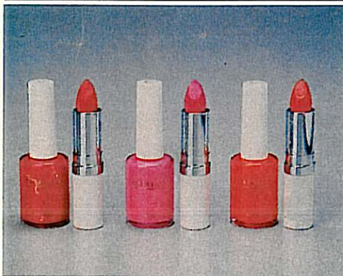
↑ この秋は、唇と指先のカラーコーディネートを楽しんでね

シンプルなスキンケアシステムを特長とする「カタリスト」の90秋の新色、リップスティックとネイルエナメル、同系色をペアにして6名様にプレゼント。健康的なレッドやピンクで、オシャレの秋を、スポーツシックに演出しよう！ あて先 千10東京都港区南青山5-12-27 wise 512 503号室「カタリスト90秋の新色」プレゼントファイナル 係、切りは、9月30日(当日消印有効)