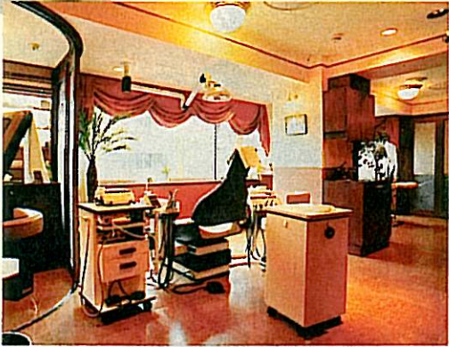
↑ 治療室もゆったりとした感で、リラックスできる、マンツーマンのカウンセリングで、執業のいくまで、丁寧に説明してくれるよ。