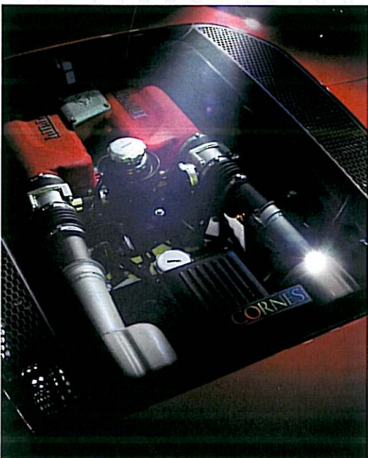
十八番の赤いエンジン上部はテストロッサ (赤い頭) と呼ばれる。

ブラが透けて見えるセクシーなブラウスや、初代iMacのブルーの筐体(かぶた)を一般的にシースルーといいますが、クルマの世界にもシースルーは存在するのです。