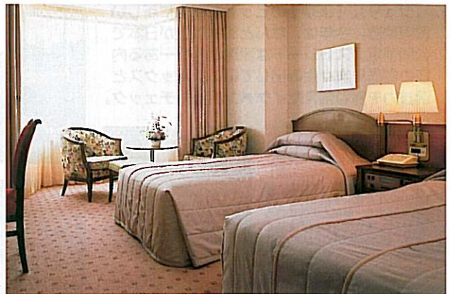
↑1泊2日プランの退室の部屋、モテレートタイプ。