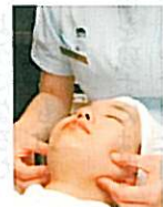
口を開きやすくする咀嚼やく筋などのマッサージもある。

高級ブティックが並ぶ帝国ホテルプラザの中にあり、一見すると歯科医院とはわからないクリニーク デュボワ。審美歯科を中心に、歯周病や虫歯の予防、治療、かみ合わせの改善などを行う歯科医院だ。ここでは、落ち着いた個室でPMTTCを受けられる。また、アメニティばかりでなく、治療でも細部にこだわ。「細かい部分の汚れを確実に