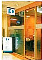
街のビルにあり、オフィスの中にも訪れやすい。

東京都千代田区丸の内3-1-1 国際ビルB1F ☎03-3214-7766 URL: http://www.418.co.jp/kb-dc/ PMTCの料金は1回1時間、9240円。