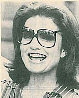
ジャクリーン・ケネディ・オナシス (故ケネディ大統領夫人)

トースペースト(歯みがき剤)は使用しなくてもいい。高級な薬用はみがきや電動ブラシでなくてもよいから、一本の歯ブラシで歯と歯ぐきの間をこきざみに振動させながらブラッシングをくりかえ